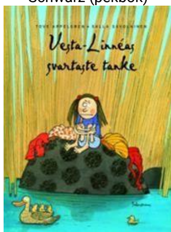
Vesta-Linnéas svartaste tanke av Tove Appelgren