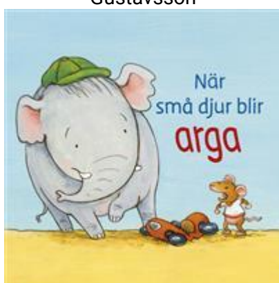
När små djur blir arga av Eva Muszynski och Regina Schwarz (pekbok)